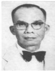
Lu K'uan Yü (Charles Luk) 1898-1978

sin obstrucción de todas las cosas en el Dharmadhatu. Su monasterio fue destruido por un incendio desastroso y se comprometió a reconstruirlo, pero se dio cuenta de que no podría hacerlo antes de su propia iluminación sin la cual él no se ganaría el apoyo para ese propósito. Entonces, se dirigió hacia el norte y en las cercanías de la capital, escaló una montaña y se quedó en su cumbre donde vivió con un ermitaño. Allí experimentó el samadhi de la vacuidad o el vacío. Esta experiencia suele ser la primera que cada meditador serio del Ch'an tiene después de que exitosamente ha puesto fin a su pensamiento. Cuando leyó la obra de Seng Chao, pronto se dio cuenta de la inmutabilidad fundamental de lo fenomenal. Durante su estancia en la montaña de Los Cinco Picos, comprendió la iluminación completa del Bodhisattva Avalokitesvara, que se describe en el Sutra Shurangama. Él tuvo muchas otras experiencias, entre las cuales dos fueron las más importantes; en cada una de ellas, él se sentó, con las piernas cruzadas y cara a cara con otro monje iluminado, inmóvil y mudo, durante cuarenta días y noches sucesivos, obviamente sin dormir. A la edad de setenta y ocho años, anunció su muerte a sus discípulos y murió pacíficamente. Su cuerpo permanece intacto en el monasterio del Sexto Patriarca.