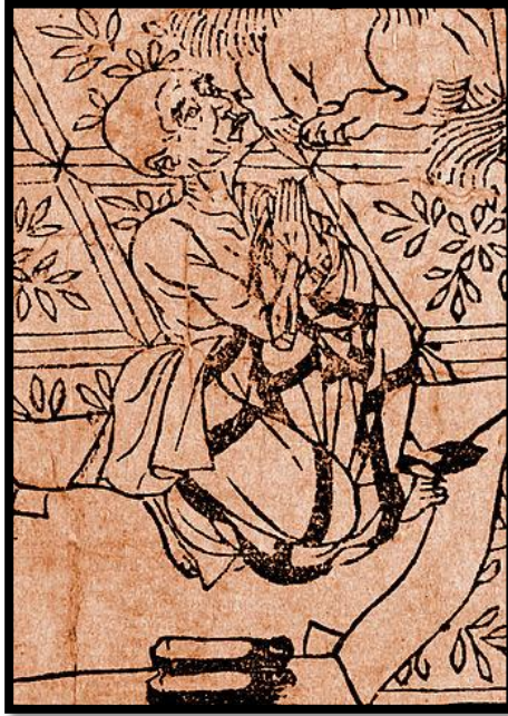
El anciano Subhuti dirigiéndose al Buda, en una de las primeras ediciones impresas del Sutra Diamante.

En ese momento, Subhuti le preguntó al Buda: “Honorable del Mundo, si un hombre o una mujer virtuosos están determinados a desarrollar la Mente Suprema Iluminada, ¿cómo su mente debe habitar y cómo (su mente) se debe pacificar?”